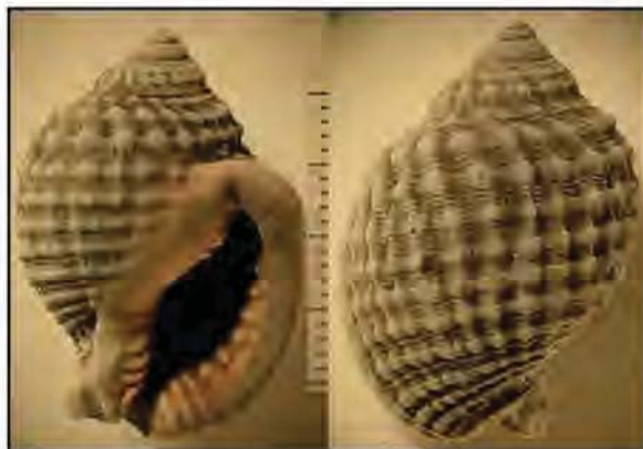
DK 757 – Semicassis rondeleti – sneglen er fundet i Gram Lergrav, men sandsynligvis er den hjemmehørende i lag fra Sen Oligocæn, måske fra Lodbjerg i Thy.