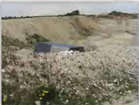
Skrivekridt dumpet i kalkgraven ved Dalbyover. Kridtet ses som lidt hvidere end den hjemmehørende kalksten.