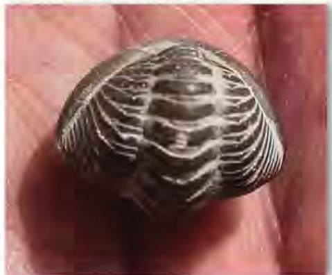
Sammenrullet trilobit, Calymene sp.

29.4. Det så lidt mørkt ud derude, da vi vågnede – det snuskregnede. Morgenbordet som vanlig god...og der var indkøbt en ny brødrister! Allerede på vej mod Lickershamn stoppede regnen. Vi kørte forbi raukerne og det blå-lilla-hvide tæppe med anemoner. Hist og pist sås tillige den 'nikkende købjælde' og langt ude i synsfeltet anedes 'den blå jomfru'. Raukerne er kalkstenssøjler, der rager op i landskabet som reminiscenser af hårde dele af tidligere koralbanker. Normalt plejer det at