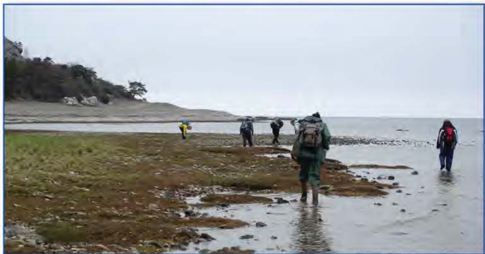
Endelig fremme ved stranden nær Grogarnshuvud.

te gennem Roma med Kungsgården og klosterruinen, men også det lokale whiskydestilleri. Ad kringlede grusveje, hvor forrevne fyr og enebær prydede landskabet, snoede bilerne sig ned fra det 32 m høje Grogarnsberget til stranden.