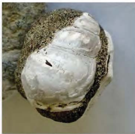
En stor pelikanfodssnegl, Drepanocheilus speciosus, fra Øvre Oligocæn

Den vellykkede tur sluttede, som den begyndte: i pragtfuldt sommervejr, så det kan man da kalde en rigtig sommerudflugt!