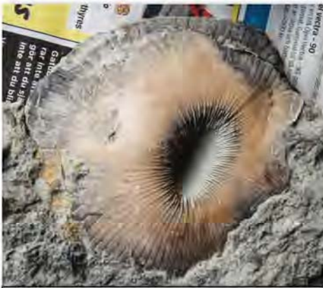
Koral, Schlotheimophyllum patellatum