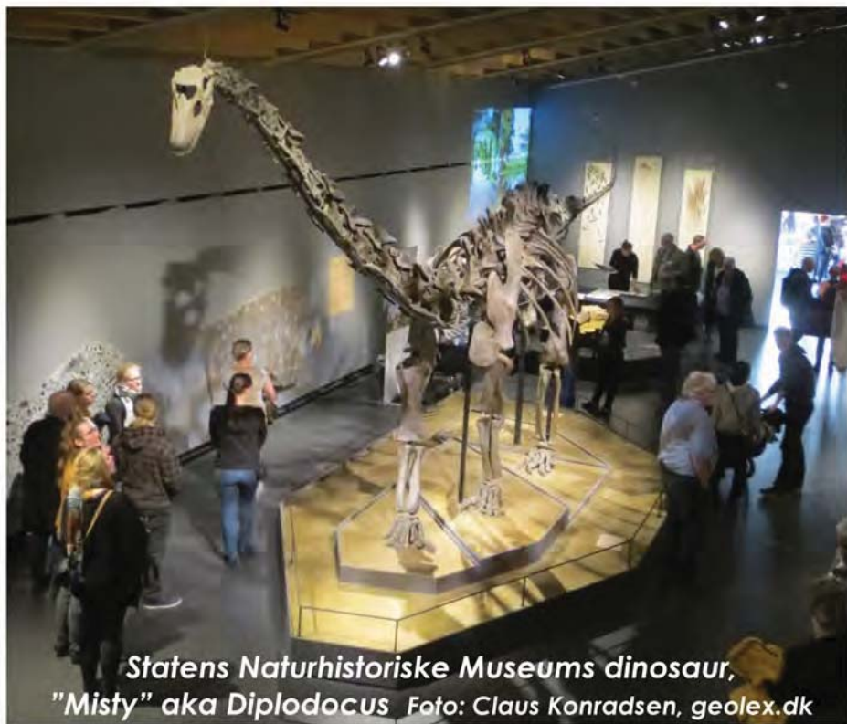
Statens Naturhistoriske Museums dinosaur, "Misty" aka Diplodocus

41. årgang nr. 3 september 2015 Total nr. 149