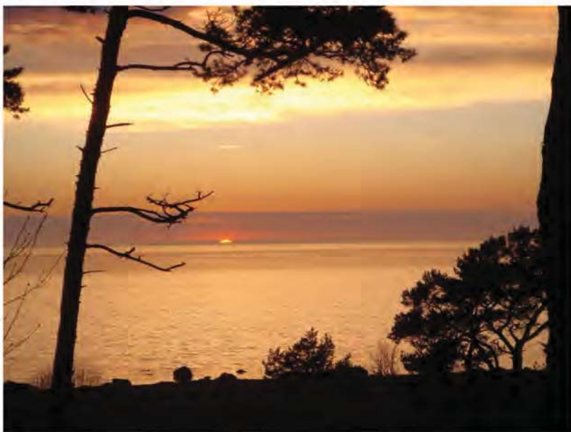
Solnedgangsstemning ved Lummalunda Vandrarhem

Der blev handlet ind hos Tempo og nogle nøjedes ikke med én salmiakis... de smagte nu også...! Hjemme forestod et større rengøringsarbejde med de lerede fossiler. Aftensmaden var farsbrød med grønt og lækker pandekage med safran. Dagen sluttede med atter en flot solnedgang, irish coffee og megen snak.