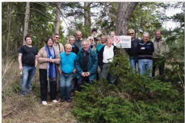
Endelig adgang til Tofta Skjutfält – alle slap dog levende fra mødet med skydebanen.

2.5. Nedpakning, rengøring og sejlads i magsvejr til fastlandet fik vi overstået først på dagen, og så hed næste stop Ignaberga Kalkbrud, som ikke længere er noget stort sted. På en hurtig rundtur fangede vi dog en håndfuld belemnitter og lidt muslinger. Nok til at holde de værste fossilabstinenser nede på resten af hjemturen.