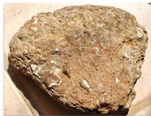
Et af dagens fund: et stykke "forstenet havbund", som ligner en Katholmblok