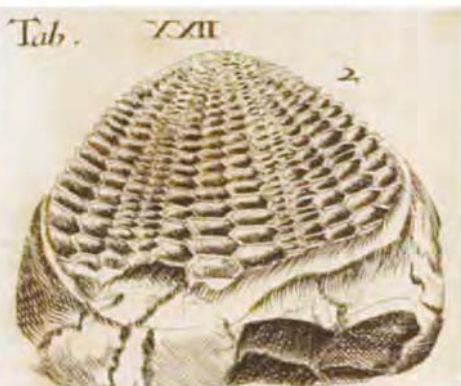
- og Olearius's tegning fra 1666

I 1655 udkom Ole Worms Museum Wormianum seu Historia Rerum Rarium med en lille tegning af et sådant søpindsvin. Adam Olearius lod i 1666 et andet eksemplar aftegne.