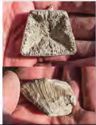
4-kant koral, Goniophyllum pyramidale

27. 4. Vi stod op til en smule snuskregn, men heldigvis ikke megen vind. Morgenbordet, som vanlig, tillokkende og varieret. Hvis ikke vi var helt vågne blev vi det! Ragnas brød satte sig fast i brødristeren og dermed kraftig røgudvikling – brandalarmen virkede! –Og ingen vidste, hvordan den kunne slukkes! Mange gode råd og flere ting blev afprøvet...intet hjalp før den tilkaldte vært, Torgny, fik slukket for hylerien. Efter dette postyr var vi klar –dagens mål, Grogarnshuvud. Tværs over øen hvor vi bl.a. kunne iagttage traner, kør-