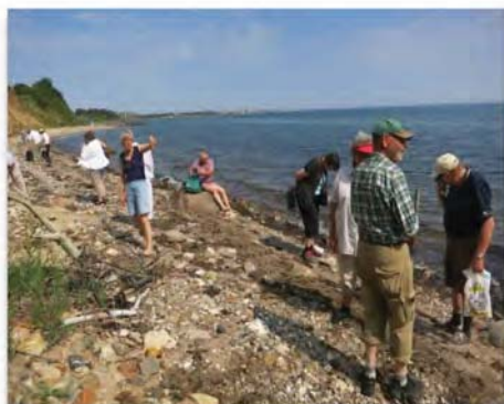
Dagens strande inspiceres nøje i den kraftige varme