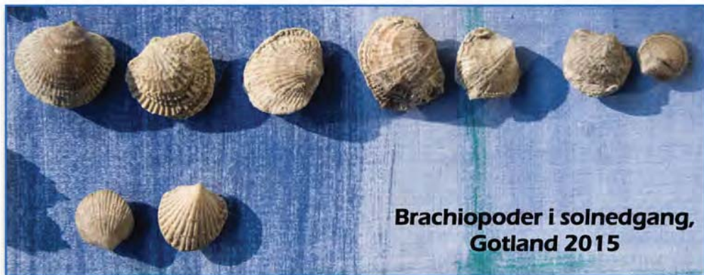
Brachiopoder i solnedgang, Gotland 2015