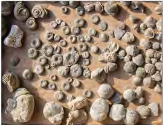
Noget af fangsten fra Lundsklint.

30.4. Turens næstsidste dag tilbragte vi langs Lusklint/Lundsklint, solen skinnede og vi ”forsamlede os” igen på smukke koraller og brachiopoder i massevis. Det vakte også jubel, når der blev fundet eksemplarer af den tilførte ordoviciske svamp Astylospongia prae-morsa . Jeg vil ikke gå i detaljer med fundene, for det har de to andre referenter gjort meget bedre end jeg kan. I store træk lignede de det, vi fandt ved Rönknlint lidt længere nordpå.